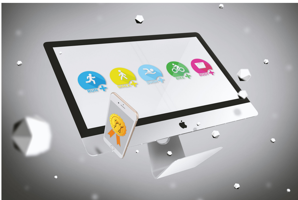
4つのワークアウトとからだ管理(イメージ画像)

ジョッグ・ファイル開発プロジェクトは老舗ランニングSNSサイト「ジョグノート」のサービス終了がアナウンスされた直後（2019年12月3日）に立ち上がりました。これまでジョグノートに慣れ親しんできたユーザーの皆さまにとっては、日々のルーティンを何ら変えることなく引き続きお楽しみいただく為の親和性を何より重視している点がジョッグ・ファイルの特徴です。当然ながらジョグノートで長年書き溜めてきた記録や日記、写真などのインポート（復元）が可能です(※2)。もちろん新規ユーザーの皆さまにとっても親しみやすく居心地のよい空間の提供をシンプルな操作で実現します。友だちとの触れ合いにより無限に広がる新しいランニングの世界と奇跡の力をぜひ体験してください。※2.サイトオープン後に開発開始