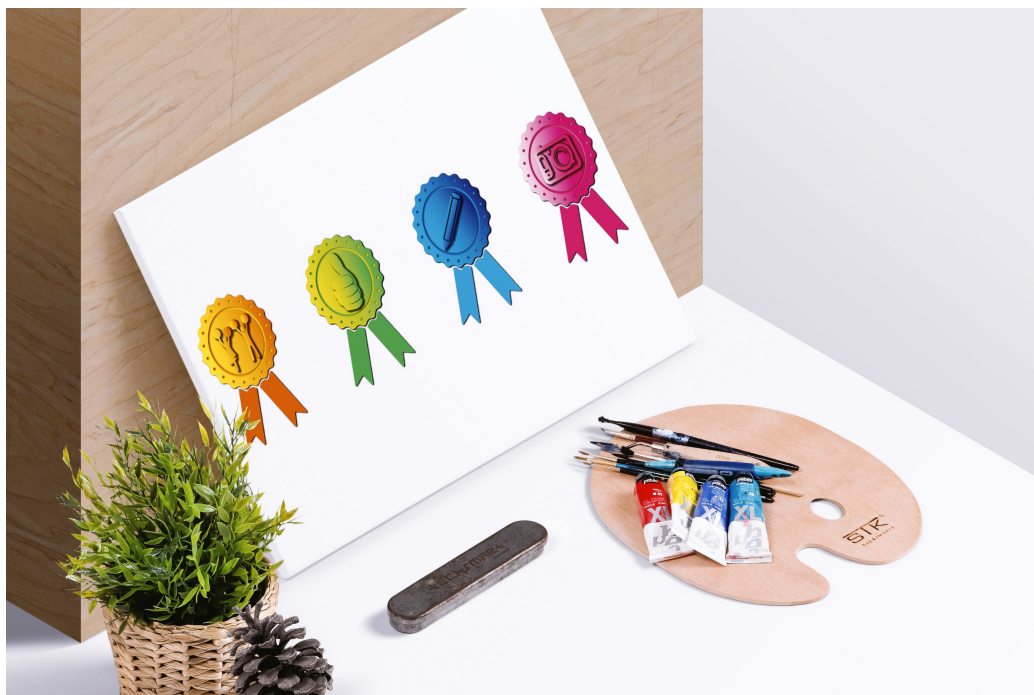
4つの応援メダル(イメージ画像)

サイト開発や運営に携わるデベロッパーの報酬やホスティングなどに掛かるコストをカバーするため、当サイトのご利用には100円/月会費が必要となります(※3)。それによりサイトの恒久的な運営を目指すと共に、目標に向かって頑張るアスリート1人1人の毎日をより充実したものにできるようサポートとサービスの提供を実現します。その使命を全うするためにジョッグ・ファイルは誕生し存続し続けることを宣言します。※3. 決済手数料削減のため一年分の一括払いを採用(クレジットカード決済)