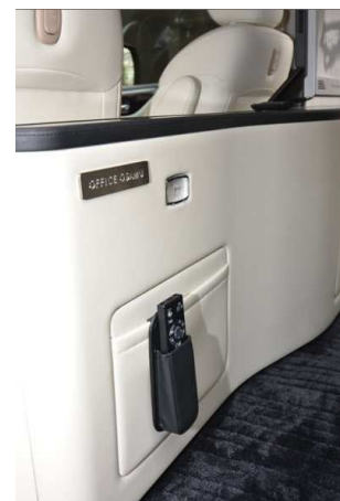
OFFICE OSAMU のエンブレム