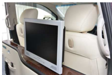
後座用 PC モニター