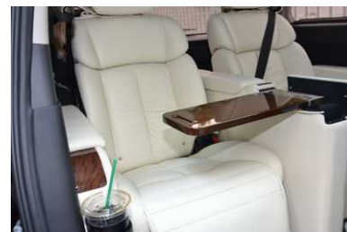
後席用収納式特別テーブル