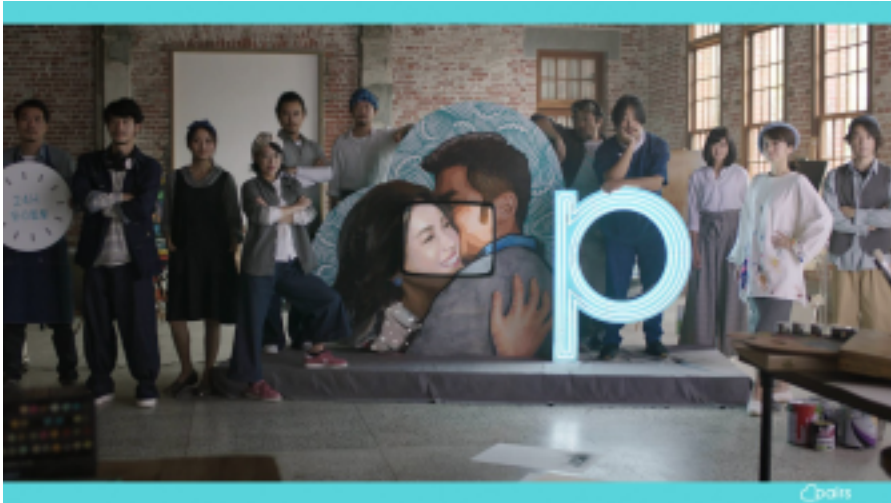
『派愛族』テレビコマーシャルイメージ

株式会社エウレカ（本社：東京都港区、代表取締役CEO：石橋準也）が運営する、恋愛・婚活マッチングサービス『Pairs（ペアーズ）』の台湾版『派愛族』（ https://www.pairs.tw/ ）は、2019年2月5日、台湾全域の地上波およびケーブル放送にてブランドコマーシャル放送を開始したことをお知らせいたします。Pairs台湾版『派愛族』として、今回が初めてのテレビコマーシャル放送となります。