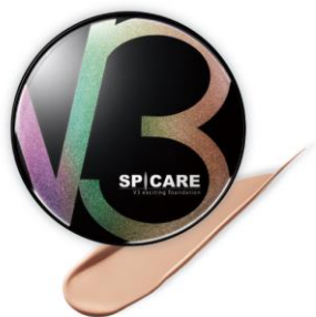
V3 エキサイティング ファンデーション 仕上がり: ツヤ感※11 / リフティング※11 / 水光グロウフィニッシュ おすすめの肌質: 乾燥肌・複合肌 価格: 8,800円(税込) 内容量: 15g SPF37/PA++

2020年3月の第1作目発売からわずか4年あまりでシリーズ累計販売数を462万個※9を突破した大人気エステファンデーション。天然の微細針「イノスピキュール※10」を用いて、メイクタイムを極上のスキンケアに昇華させ、メイクオフ後の肌を美肌へと導きます。肌悩みや好みの仕上がりに応じた3種をラインナップ。独自の原料配合と発酵技術による1色展開でどんな肌色にもフィット。色選びで悩む必要がないのも魅力の一つです。