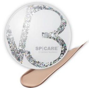
V3 プリリアント ファンデーション 仕上がり: ブライトニング※11 / シワ対策※11 / 密着マットフィニッシュ おすすめの肌質: 年齢肌・乾燥肌 価格: 9,350円(税込) 内容量: 15g SPF40/PA++

※9 2024年4月末時点 ※10加水解カイメン(整肌) ※11メイクアップ効果による