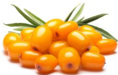
サジー(ヒポファエラムノイデス果実エキス)

豊富なビタミンCはもちろん、肌をサポートするポリフェノールやβ-カロテンがエイジングサインに多角的に働きかけ、健やかな肌に整えます。