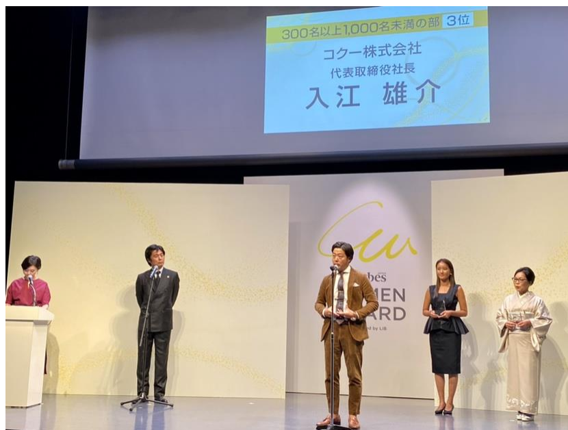
Forbes JAPAN WOMEN AWARD 2021 授賞式