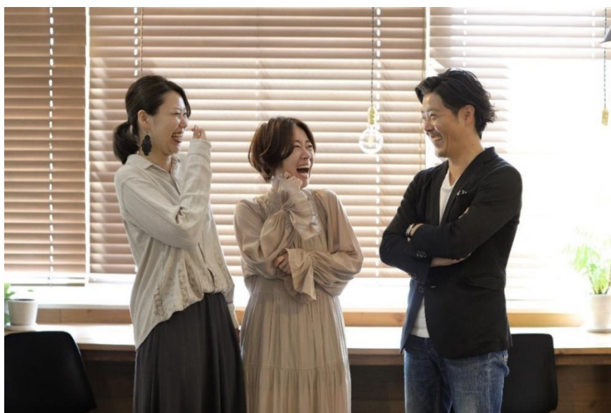
当社で活躍する女性社員の様子