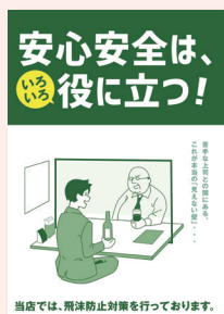
当店では、飛沫防止対策を行っております。