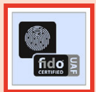
FIDO UAF 生体認証