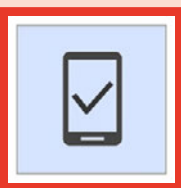
プッシュ通知 認証