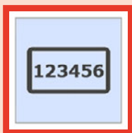
ワンタイム パスワード認証