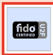
FIDO U2F デバイス認証