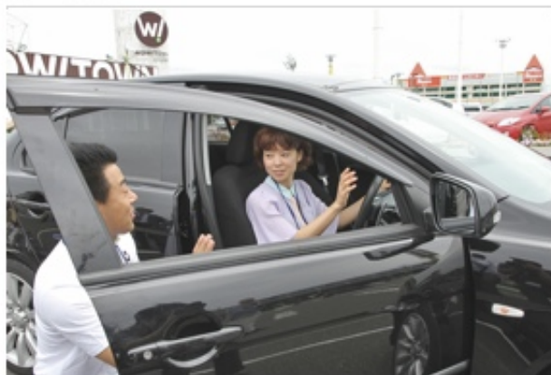
<教官のいる店舗実現模様>