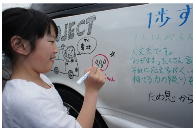
<メッセージカー実現模様>