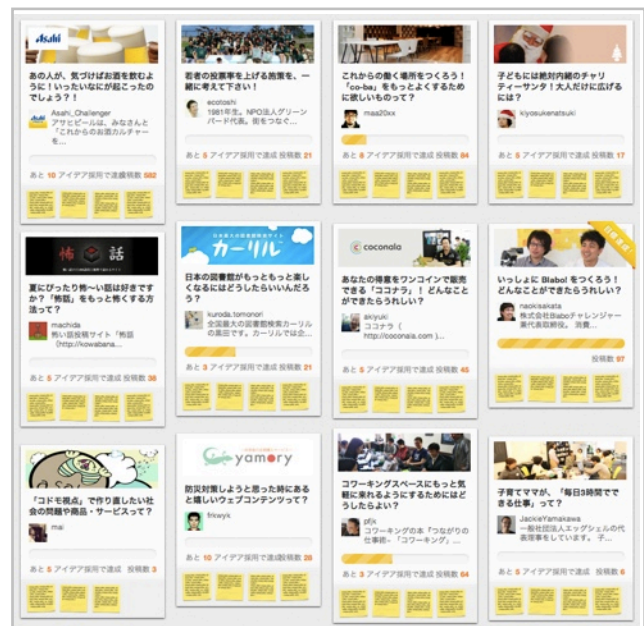
アイデアボード一覧