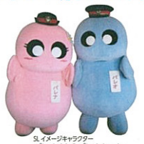
イメージキャラクター パレオくん&パレナちゃん

パレオくん&パレナちゃんのツイッター twitter @paleo_palena