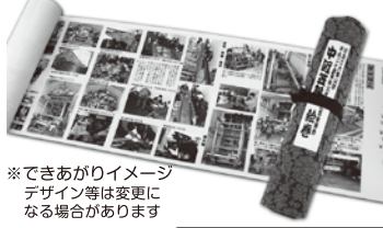
※できあがりイメージデザイン等は変更になる場合があります

※急行列車にご乗車の場合、上記乗車券のほかに急行料金(大人200円小児100円)が別途必要となります。当日ご乗車になる駅窓口でお買い求めください。