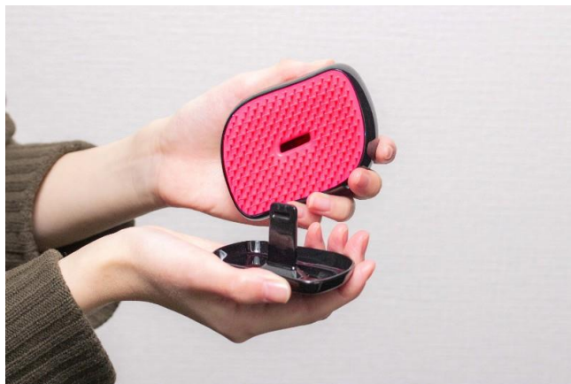
タングルティーザーで唯一のブラシカバー付き。