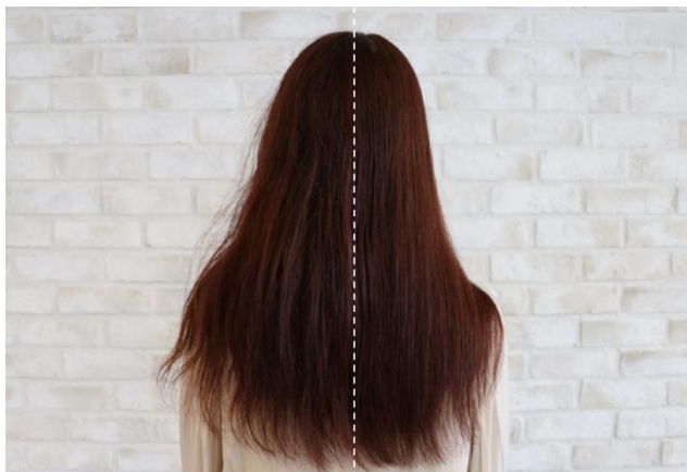
（左）ブラッシング前（右）ブラッシング後

特許取得（日本・UK・EU）の長短二段構造と米国デュポン社が開発した特殊素材のブラシが、ブラッシングによる髪の毛の摩擦やダメージを最小限に抑えて、サラサラ艶やかな美しい髪へと導きます。また、ブラシ部分を保護するカバーが付いているのでブラシが折れ曲がる心配がなく、外出先やスポーツの後、旅行や出張先などでも活躍します。