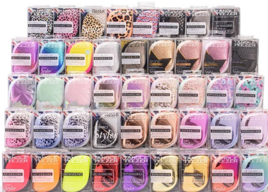
これまで発売したコンパクトスタイラーの一部

コンパクトスタイラーは、2013年に日本へ上陸し、これまで約100種類のデザインを発売してきました。