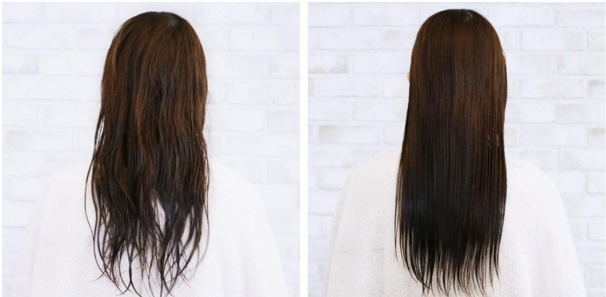
(左) お風呂上り、タオルドライのみ (右) 全体をブラッシング

余分な水気を切り、絡まりを解きほぐすことで髪が整います。その結果、より速くキレイに乾き、髪への負担も軽減します。