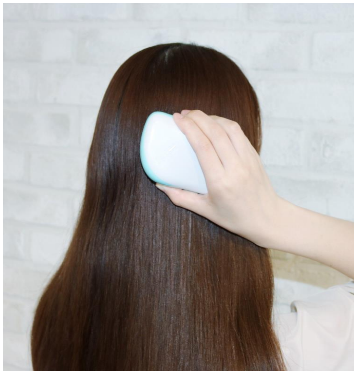
手のひらで握りこむ形状により、力加減の調節がしやすい

ブラッシングをしてキューティクルを整えることで、ツヤが生まれてキレイに見えるだけでなく、髪の内部の水分や栄養分が流れ出るのを防ぐことができます。