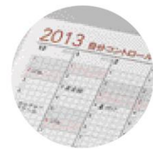
自分コントロールページ