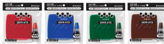
【赤】 【青】 【緑】 【茶色】