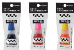
【青】 【桃色】 【黄色】