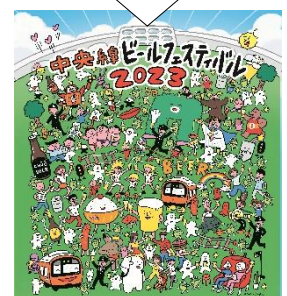
ビジュアルも年々よりにぎやかに！