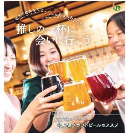
中央線ライフを楽しむWEBマガジン「中央線が好きだ。」7月は『中央線クラフトビールのススメ』特集！