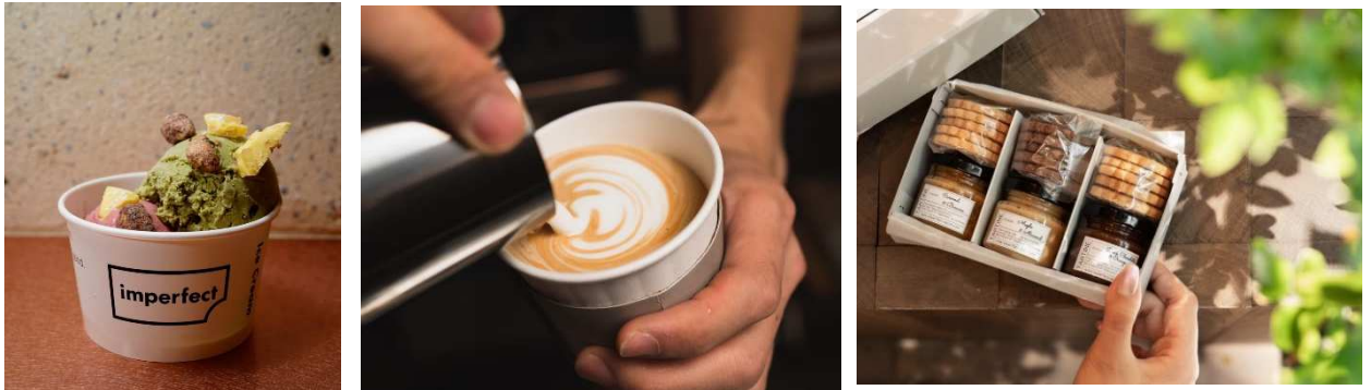
*写真左からアイス、ラテ、サブレ・タルティーンヌ。

本 POP UP でも、ミツバチの生育環境を整えながら生産されたアーモンドを使用したアイスや、女性の活躍をサポートしながら生産されたコーヒー豆のラテ等、imperfect おすすめの商品をお買い求めいただけます。