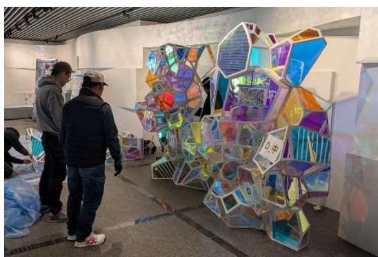
大阪本社への移設の様子

当社が考えるアフター万博の取り組みとして、「当社展示ブースからはゴミは一切出さない」という想いのもとスタートし、その想いを基本理念「 THINK CIRCULAR for SPACE AGE(宇宙時代の循環思考) 」を掲げました。サステナビリティ推進を加速してパーパス「美しい人生を、かなえよう。」のもと、持続可能な社会を目指すとともに、出展を通じて伝えたかった当社の想いや体験価値を未来へ残していこうという取り組みです。