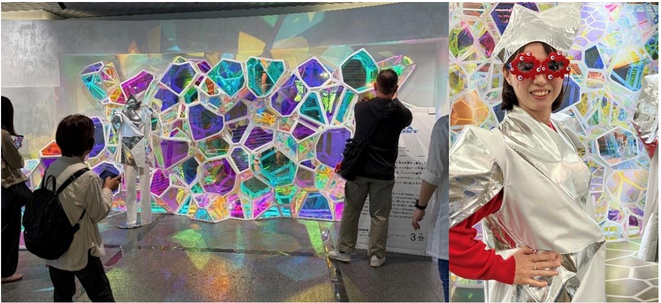
左)2026年5月に実施した当社大阪本社の展示移設一般公開の様子 右)ユニフォーム試着体験イメージ

本取り組みは、「THINK CIRCULAR for SPACE AGE(宇宙時代の循環思考)」を基本理念に掲げ、持続可能な社会を目指そうと進めたものです。万博の感動と思想を一過性のものに終わらせず、次世代へ継承していくことを目的とした、当社サステナビリティアクションプランの一環として実施いたします。