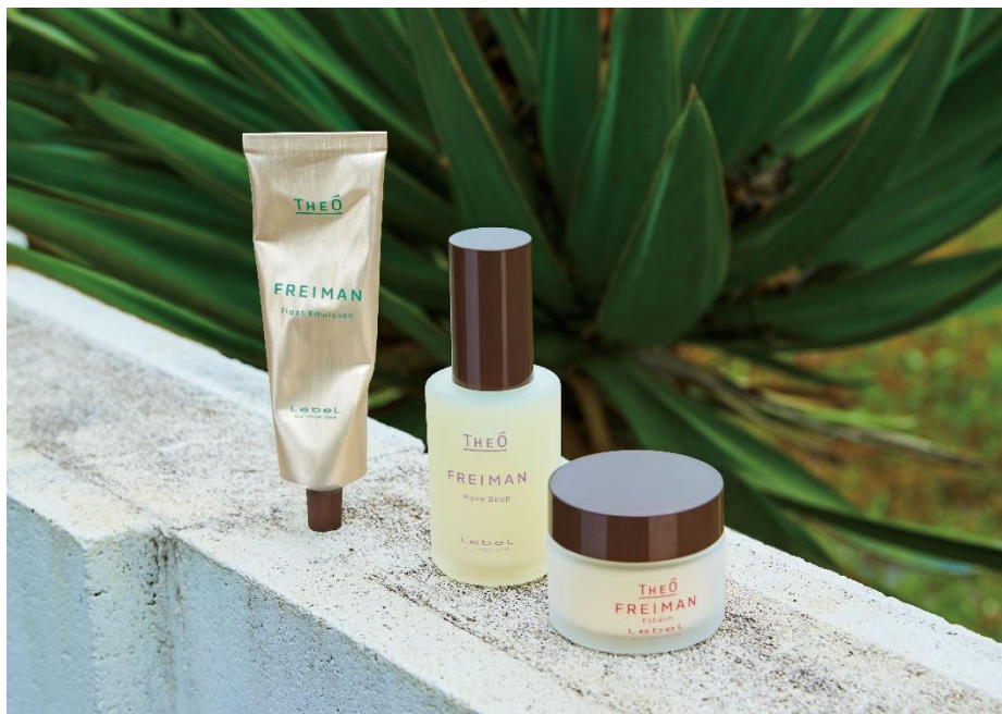
左から:ジオ フレイマン フロートエマルジョン、ジオ フレイマン ムーブドロップ、ジオ フレイマン ファイバーム