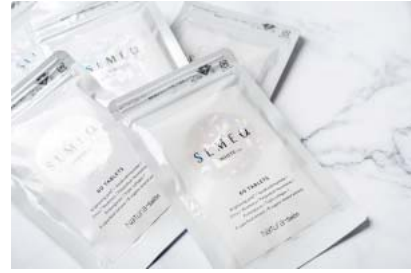
インナービューティサプリ