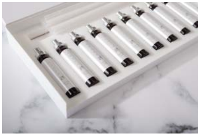
美容ドリンク『HAQRA（白桜）』

厳選した美容成分38種が体内の活性酸素の増加と炎症を抑制しつつ、お肌にハリ、弾力、潤いを与え、糖化もケアする高濃度配合！肌の潤いをアップし透明感のあるお肌へ導きます。