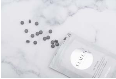
ダイエットサプリ