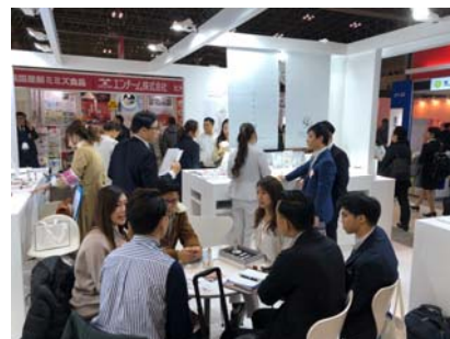
※2020年1月の第8回 国際化粧品展【東京】での商談風景

なお、本展示会では、売上が2倍になった奇跡のホームケア商品、ドットイーの活用ビジネスモデルを、包み隠さずお伝えします。お客様に『整形級』という評価をいただくドットイー®の効果は、会場はもちろんオンラインでも実感できる仕組みをご用意しています。コロナ対策を施したブース計画を行っていますが、会場にお越しになれない全国のエステサロンのため、 オンライン Zoom 商談を随時受け付け ておりますので、ぜひお気軽にお申し込みください。