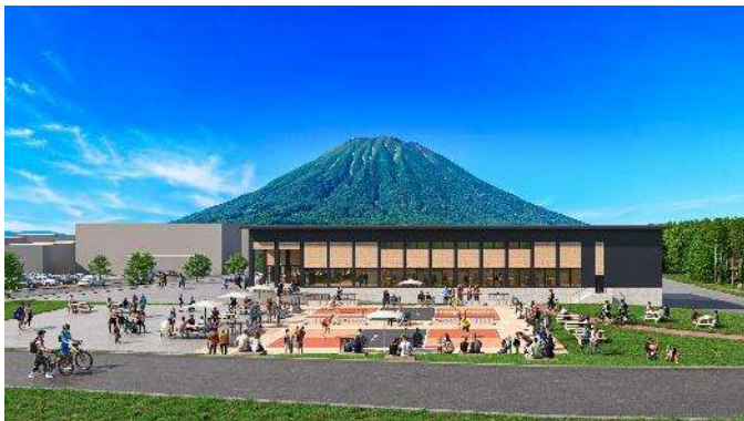
ピックルボールコート（イメージ）