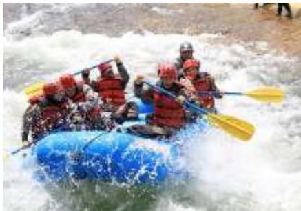
ニセコラフティング