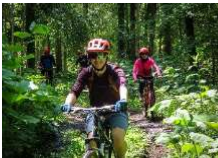
マウンテンバイクツーリング