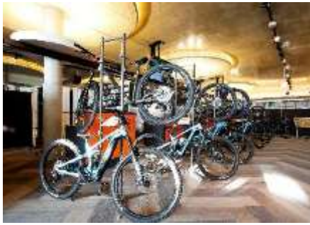
レンタルバイク(マウンテン、ロード)