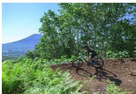
MTB BIKE PARK