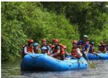
ファミリーラフティング