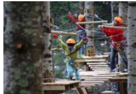
アドベンチャーパーク