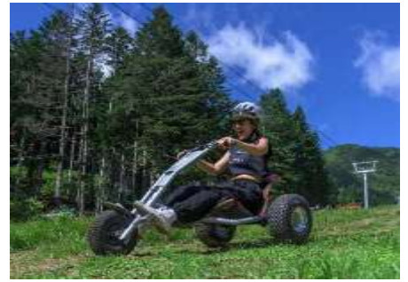
マウンテンカート