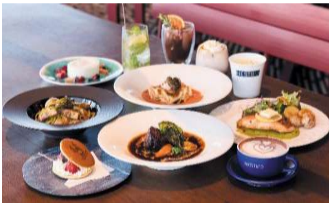
NEST813 メニューイメージ

【営業時間】カフェ8：30～16：00（15：30L.O.）／ランチ11：00～14：30