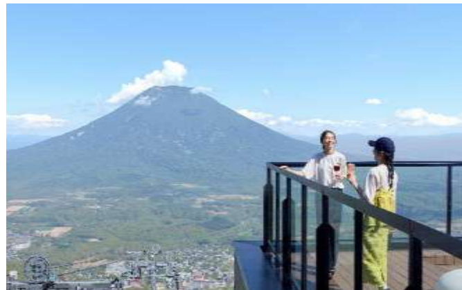
YOTEI SKY TERRACE