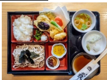
藪そば定食 築地藪そば

<メニュー例> ※下記メニューについては食事券差額無しにてお召し上がりいただけます。