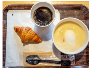
半熟たまご入りシチューセット センリ軒