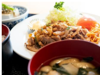
豚生姜焼き定食 東都グリル魚河岸食堂店