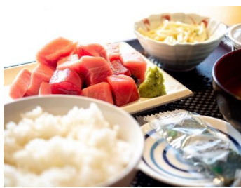
マグロ定食 小田保