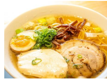
とりそば 鳥めし鳥藤魚河岸食堂店