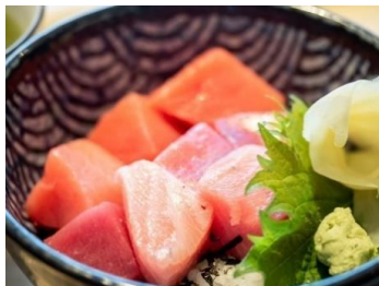
マグロ丼定食 てっか屋