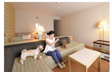
レジデンシャルスイート（ペット対応特別室 80 m 2 、2 部屋）