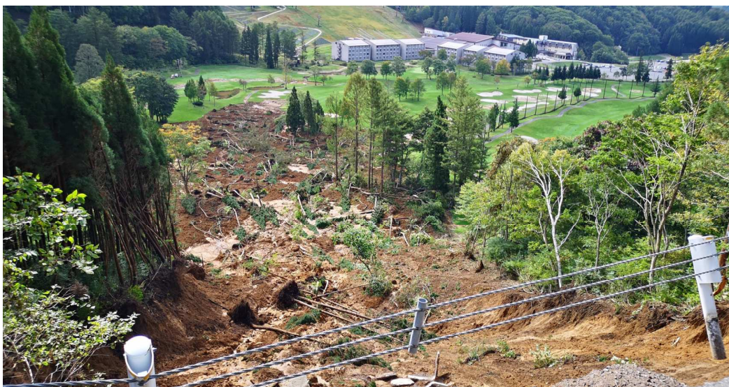
2019年10月土砂崩れ発生 ゴルフ場3ホールがプレー不可能に