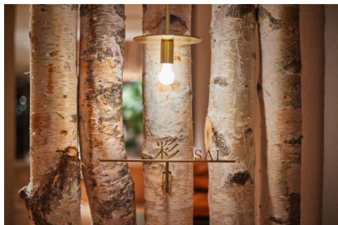
白樺の木を使用したレストラン「彩」入口