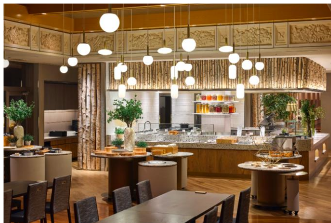
開放感を感じさせる明るい店内に改装しました