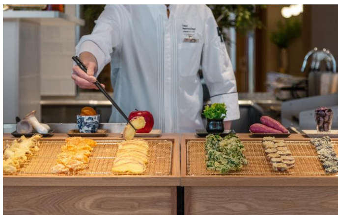
ライブキッチンにて提供「天ぷら」

ホテルハーヴェスト旧軽井沢のbuffetレストラン「彩」は【FOREST ACTIVITY～信州軽井沢の恵みと出会う。森の「アクティビティ」～】をテーマに、白樺の木を基調とした温かみのある、開放感溢れる空間に店内を改装しました。新メニューには株式会社ユーハイム（以下「ユーハイム」）が開発したAI搭載のバウムクーヘン専用オーブン「THEO（テオ）」による「焼きたてバウムクーヘン」や、旬のフルーツを使った自家製「季節のフルーツタルト」が登場します。また、活気と躍動感溢れるライブキッチンではスパイスが効いたジューシーな「ローストビーフ」や、信州食材の林檎、杏、花豆と旬野菜をサクッと揚げた「天ぷら」をご用意いたします。お肉、野菜、果実の“信州の恵み”が詰まった和洋 50 種類以上のお料理をお楽しみいただけます。