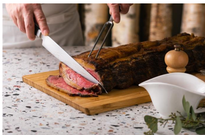
ライブキッチンにて提供「ローストビーフ」