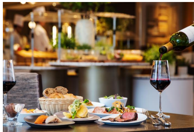
お酒とのペアリングもお楽しみいただけます