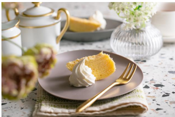
付け合わせにホイップクリームとお楽しみいただけます