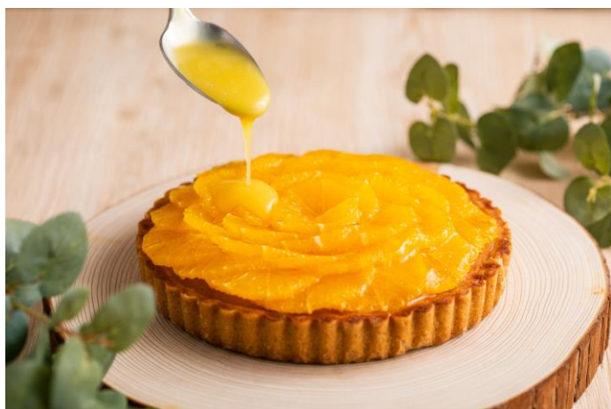
季節のフルーツタルト