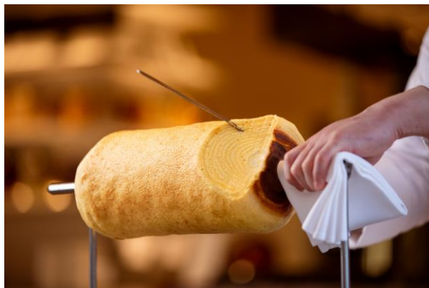
焼きたてを切り分けて提供いたします

3月4日【バウムクーヘンの日】は、日本で初めてバウムクーヘンを焼き、販売をした日として2010年にユーハイムが決めました。AI搭載のバウムクーヘン専用オーブン「THEO（テオ）」は、密封性に優れており、生地を空気を含ませながら自動で約20分をかけてゆっくり焼き上げます。全長30cm、13層に焼き上げられたバウムクーヘンは、ユーハイムのドイツ製菓マイスターたちにより作り上げられたレシピで、食品添加物を使用せずに砂糖・バター・小麦粉・卵のみで焼き上げています。