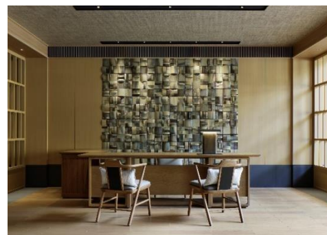
THE ROKU SPA