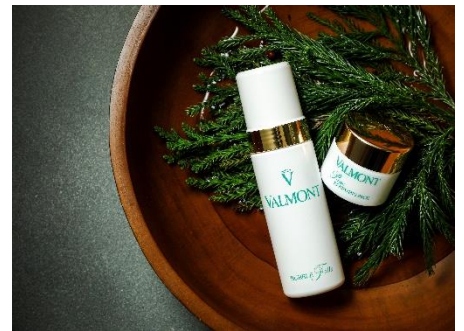
Exclusive ROKU VALMONT Facial

2022 年のクリスマスケーキは、サンタクロースをモチーフにした艶やかなムースケーキ「Père Noël (ペール ノエル)」と、雪の降り積もったもみの木をイメージした純白のストロベリーショートケーキ「Sapin de Noël (サパン デュ ノエル)」の 2 種類をご用意いたしました。12 月 24 日(土)、25 日(日)の各日それぞれ 10 個限定での販売で、ご予約開始は 2022 年 11 月 1 日(火)より開始いたします。