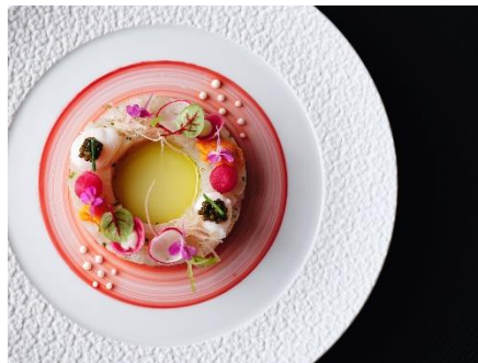
クリスマスメニュー