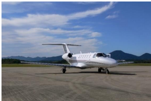
プライベートジェット イメージ

1月1日の早朝にプライベートジェットで出発し、上空から初日の出を眺めるツアーが付いた宿泊プランを1グループ限定で販売いたします。初日の出フライトでは、約2時間の遊覧飛行にて富士山や三重県伊勢神宮などを周遊し、プライベートな空の旅をお楽しみいただけます。機内に用意したこだわりのシャンパンを片手に、優雅に初日の出を迎えていただけます。空気の澄んだ朝、新しい気持ちで迎える1年の始まりをご家族やご友人同士、大切な方と一緒に過ごしてください。