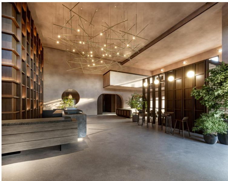
ロビーラウンジイメージ

「nol hakone myojindai」は、当社が1993年に開発した会員制ホテル「東急ハーヴェストクラブ箱根明神平」を改装し、2024年5月に当社ホテルブランド「nol」として、リブランドオープンするリゾート施設となります。人気の観光地箱根の中でも閑静な宮城野エリアの別荘地内に所在し、お客さまが「自分らしく、普段通りに、その地域を楽しめる」ホテルをめざします。なお、予約受付は11月1日（水）より開始いたします。