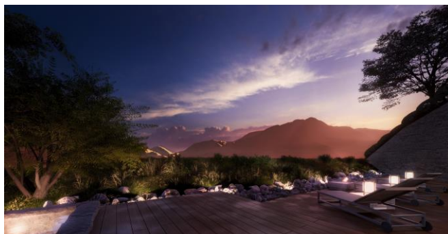
プール外デッキイメージ