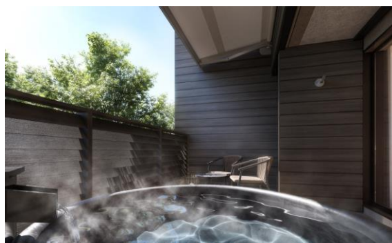
客室温泉露天風呂イメージ