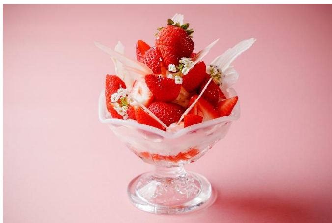
苺ミルフィーユパフェ

ROKU KYOTO, LXR Hotels & Resorts (京都市北区、総支配人：西原吉則、以下 ROKU KYOTO)は、2024年1月15日(月)～3月31日(日)の期間中、レストラン「TENJIN」にて、旬を迎える苺を使用したこの季節だけの苺パフェと苺カクテルをご提供いたします。