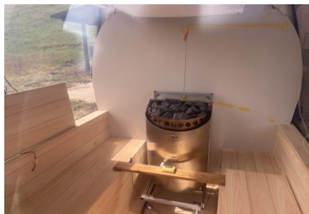
ゴンドラサウナ室内