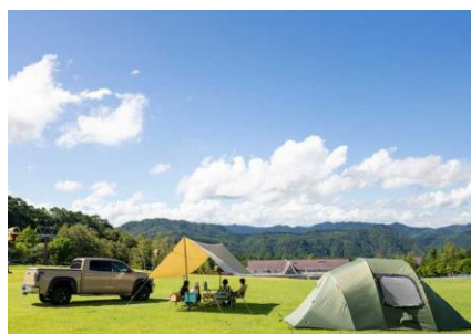
ハンタービューサイト