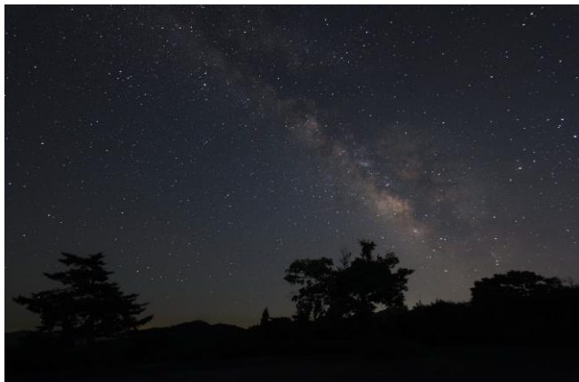
夏の夜空に輝く天の川

ベース標高1,200m、街の明かりが届かないハンターマウンテンキャンプパークでは、気象条件により天の川をはじめ満天の星空が観測できます。2024年8月12日(月)の23時頃からは三大流星群の一つと言われる「ペルセウス座流星群」の活動が極大となることが予測されます。条件が揃えば1時間に20個以上の流星が見られるかもしれません。キャンプご利用のお客様には、月や星の観測グッズとして「星座早見表」をご希望の方にお渡しいたします。またプレミアムエリアご利用のお客様には、ゲストハウス内に「Vixen社製天体望遠鏡」をご用意しているので、お好きなタイミングで夜空の観測をしていただくことができます。