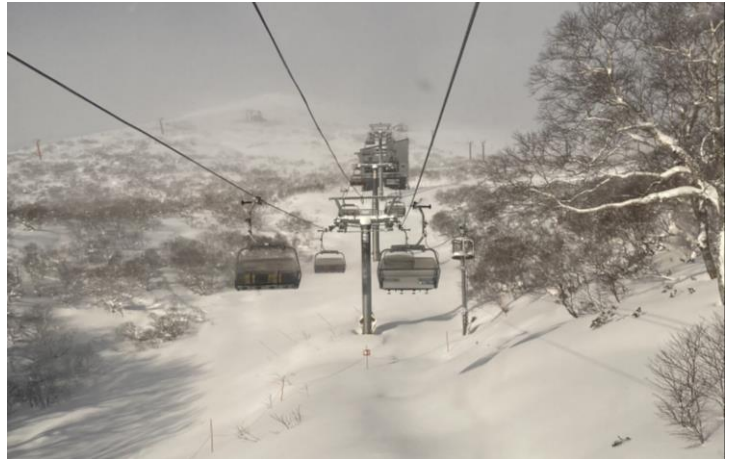
現行のキング第3リフト