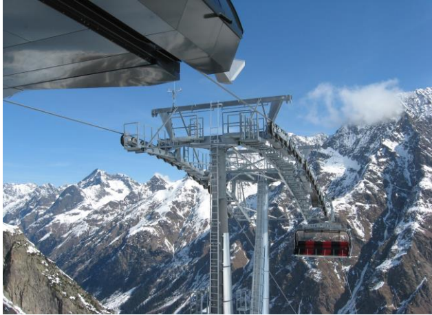
新6人乗りチェアリフト（イメージ）

なお、来春より「キング第3リフト」の工事着工を予定しているため、2024-2025 ウィンターシーズンの営業につきましては2025年3月31日（月）までといたします。