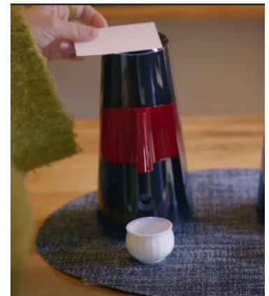
「のまっせ」ご利用イメージ

【公式 URL】 https://www.tokyustay.co.jp/hotel/KR/hanare/