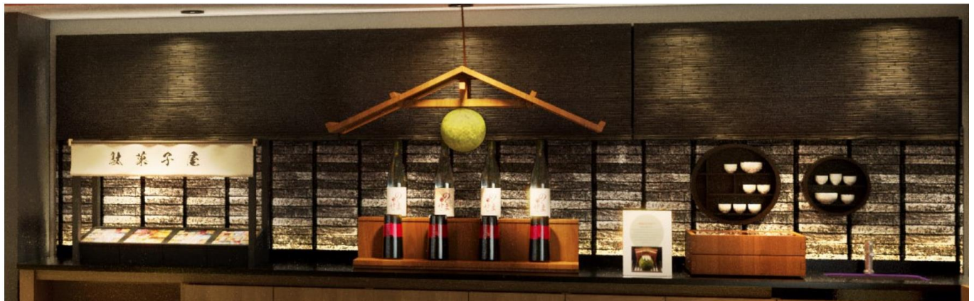
日本酒、驒菓子コーナーイメージ