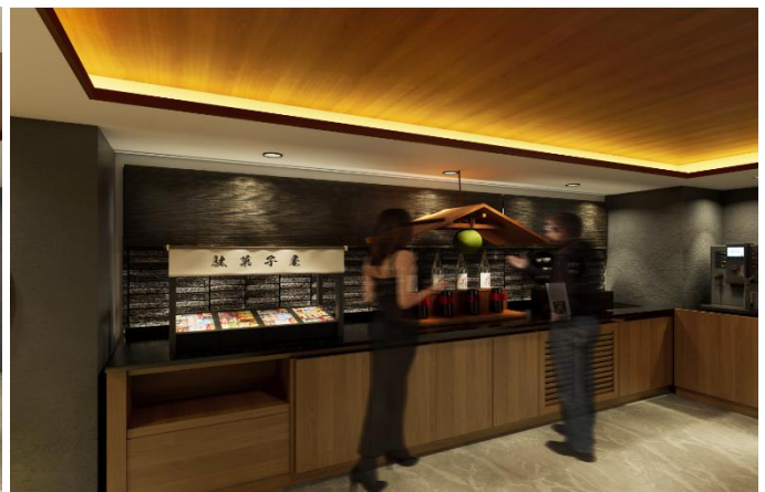
「らうんじはなれ」イメージパース