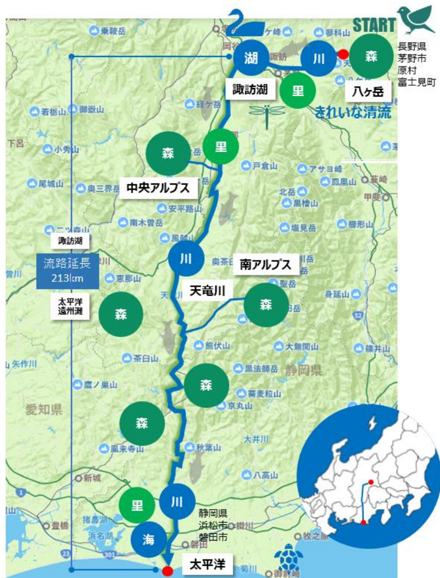
天竜川流域図（八ヶ岳～諏訪湖～天竜川～太平洋へ）

今回の「もりフェス」は第1回として「森」をテーマとしていますが、第2回「里」、第3回「川」、第4回「海」とテーマを変えながら継続的に開催することで、より豊かで自然と共生した未来を作ること、一人一人のライフスタイルシフトを生み出すことを目的としています。