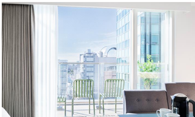
東急ステイ渋谷新南口 客室イメージ

渋谷 SAUNAS 公式サイト： http://saunas-saunas.com/