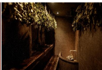
ヴィヒタサウナ室内