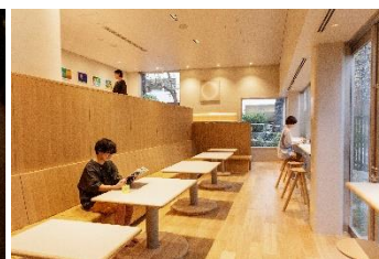
ワーキングスペース