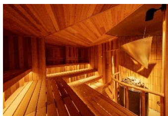
サウンドサウナ室内