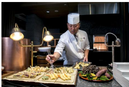
ホテルレストラン