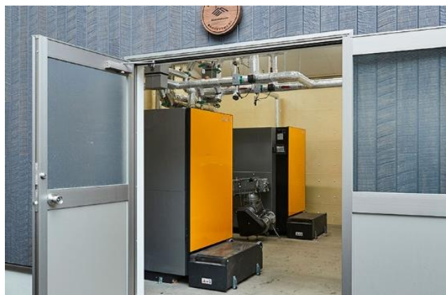
東急リゾートタウン蓼科に設置されたバイオマスボイラー

当社では廃食油を SAF などに再利用する活動のほか、ホテル 87 施設でアメニティ製品（歯ブラシ、ヘアブラシ、カミソリ、シャワーキャップ）をバイオマス製品に変更し、プラスチック廃棄量の削減を行っています。また東急リゾートタウン蓼科では、健全な森林を未来に残すためのブランド「もりぐらし®」を立ち上げ、その取り組みの一環として、間伐で得られた材木をウッドチップに加工し、ゴルフ場に設置したバイオマスボイラーで燃料として活用するなど、エネルギーの地産地消や森林資源の有効活用を進めております。