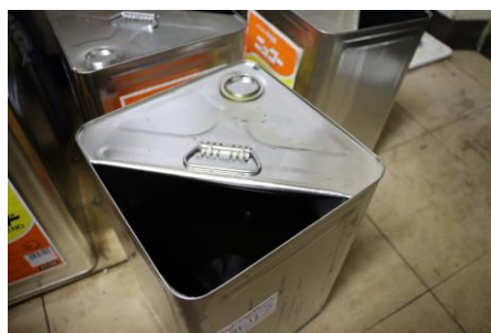
廃油回収に使用する一斗缶