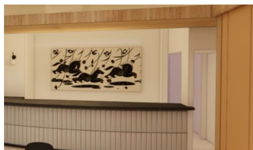
ゲストを迎えるフロントイメージ