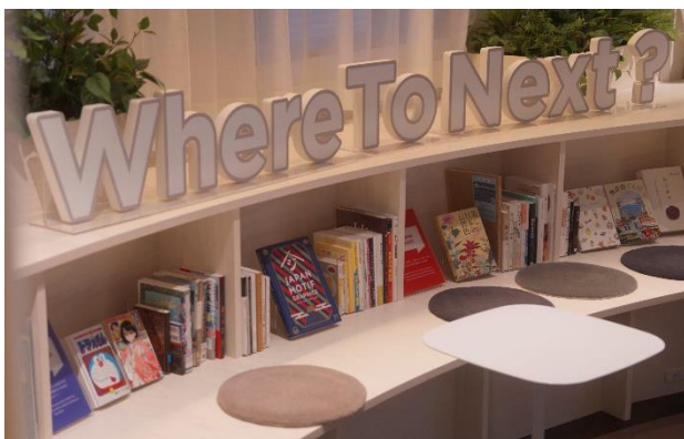
日版グループ (株)ひらくとの連携

「ここでの新しい発見が、明日からの暮らしを変える」これこそが、東急ステイの目指すホテル体験です。