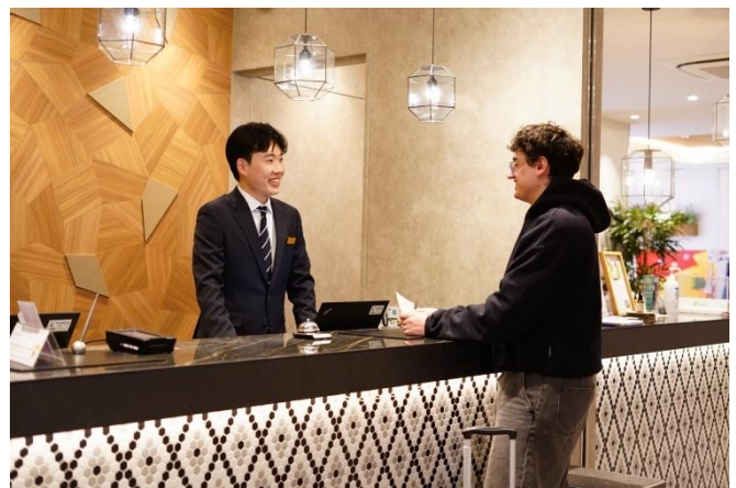
ゲストとフロントスタッフの交流