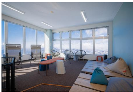
② ゴンドラ駅舎内 ラウンジ