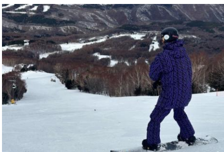
② ファーストクルージング