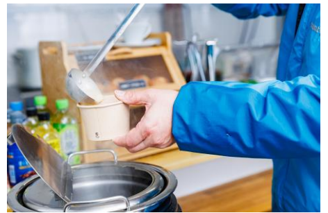
② ラウンジ内のフード等提供