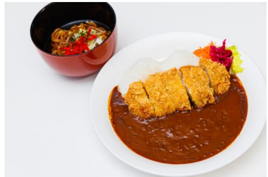
新商品のスープ焼きそばと定番のカツカレー