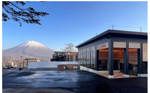
ALPEN NODE 外観

また、既存レストラン 3 店舗も北海道産の名品を世界へ発信できるラインアップへとメニューを刷新。各店での食体験を差別化し、その日の気分で“どのレストランに行こうか”と選ぶ楽しみも提供しています。単なる「ゲレ食」の域を超え、まさに「食」そのものが滞在の一つの目的となるリゾートへと進化を続けています。