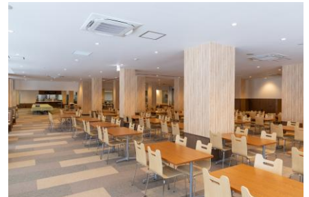
レストラン拡張エリア