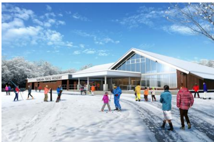
建物外観（パース画像）