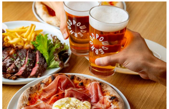
ALPEN NODE 料理イメージ