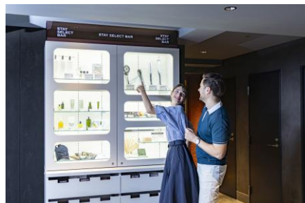
“セルフ”アメニティボックス「STAY SELECT BAR」 日本の美意識を持つブランドの厳選セレクト商品