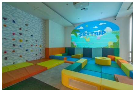
東急ステイ沖縄那覇「SKY TRIP」 アナログとデジタルが交わるキッズスペース

【姉妹ブランド】 nol kyoto sanjo（京都市中京区）、nol hakone myojindai（神奈川県箱根町）