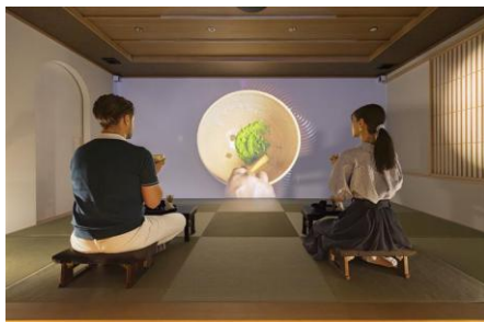
HANARE by Tokyu Stay「茶幻 ~sagen~」 伝統文化とテクノロジーが融合したデジタル茶室空間