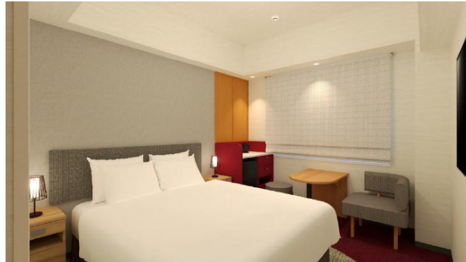
「リニューアル後の客室」イメージ図