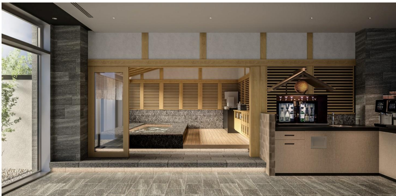
東急ステイ京都三条烏丸1階に新設した休憩処「足湯」イメージ図

客室は、通りを挟んだ場所に2025年9月リニューアルオープンした「HANARE by Tokyu Stay」とのつながりを持たせ、落ち着いた雰囲気の中に鮮やかなアクセントカラーを配し、京都の美意識と心地よさを感じられる空間に生まれ変わりました。また「足湯」では、歩き疲れた足を温かい湯に浸けて癒しながら、これまでの旅で体験してきたことを振り返ったり、また次の行先へと思いを馳せたりしながら、そこに集う人々とも交流が生まれ、旅をつないでいく拠点となることを目指しています。