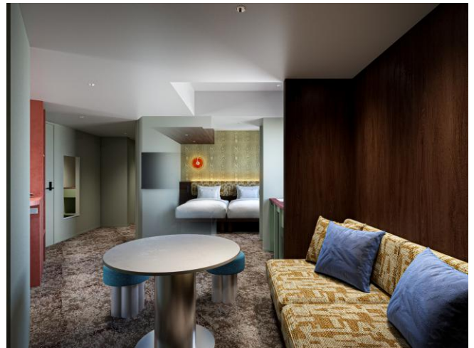
「シグネチャーファミリー」完成イメージ