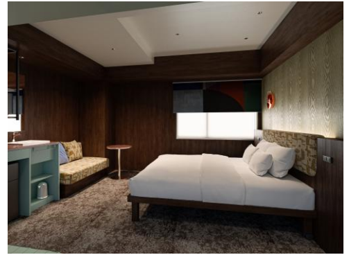
「デラックスキング」完成イメージ