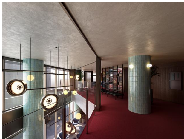
2 階共用スペース完成イメージ