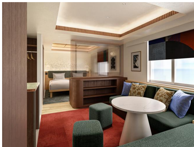
「ステイプレミア」完成イメージ