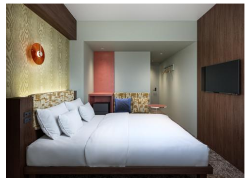
「スーペリアクイーン」完成イメージ