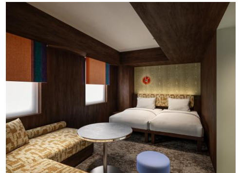
「デラックスツイン」完成イメージ

設備：ベッド(幅 1,100mm)、キッチン、電子レンジ、洗濯乾燥機、浴室セパレート