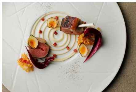
仔羊 アーティチョーク チョリソー