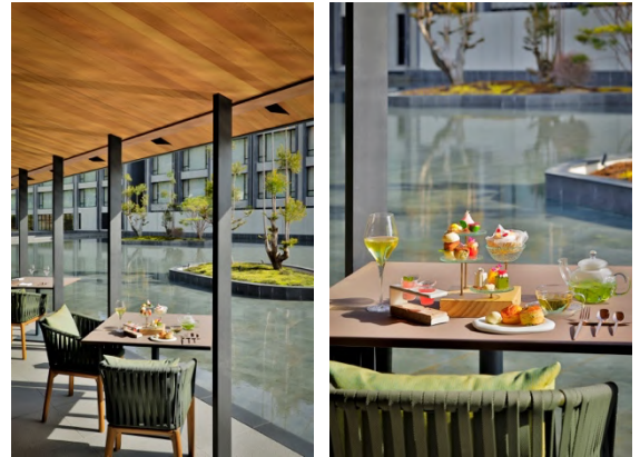
サマーアフタヌーンティー - 青嶺 -

ころんと愛らしい桃に見立てた白桃のムース「白桃 グロゼイユ」、ムースとサブレで夏のアイコンの麦藁ぼうしを表現した「麦藁ぼうし～パッションマンゴー～」、スイカのミニチュアのような遊び心あるムース「西瓜」、フレッシュな「パイナップル タルト」、ピーチメルバをイメージした白桃の「ババ」など、やさしい甘さの白桃とジューシーなトロピカルフルーツをご堪能いただけます。そのほか、穴子の手毬寿司や海老のコロッケバーガーなどのセイボリーもご用意いたします。