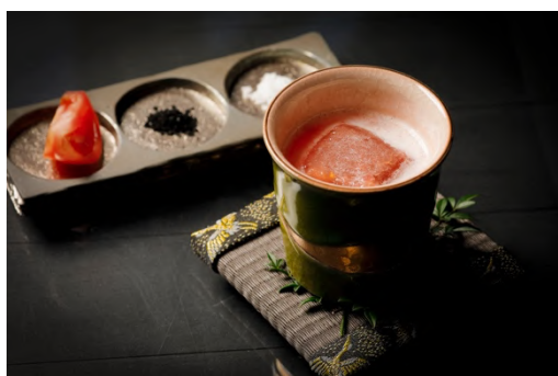
賀茂とまと ブラッディマリー

ほのかな酸味とさわやかな味わいの賀茂野菜「賀茂とまと」を使った「賀茂とまと ブラッディマリー」は、ウォッカではなく京都発のドライジン「季の美」を使用。アクセントとして京都・琴引浜の塩、黒七味を添えてご提供します。「UMAMI SOUR」は、京都産日本酒に、金沢・福光屋の黒みりんや国産和素材から生まれた「ジャパニーズビターズ」を隠し味にした、“旨み”がテーマのセイボリーカクテルです。「京つけもの もり」の和風だし香るオリーブとともにお愉しみください。また、モクテル「Sober Curious Highball」は、あえてお酒を飲まないライフスタイル「ソバーキュリアス」に寄り添い、京都「椿堂」のハーブ緑茶をノンアルコールジンに2日間浸け込み、ソーダで軽やかに仕上げた一杯です。