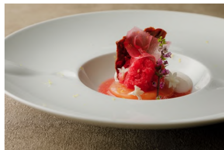
白桃 赤紫蘇 ベルガモット