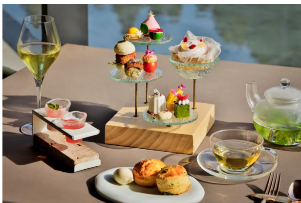
「TENJIN」オールデイダイニング サマーアフタヌーンティー -青嶺-