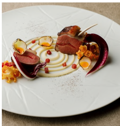
「TENJIN」オールデイダイニング メイン 仔羊 アーティチョーク チョリソー