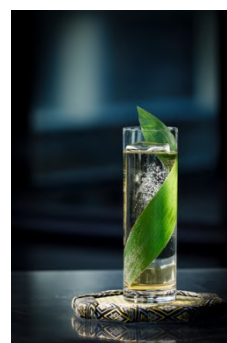
Sober Curious Highball