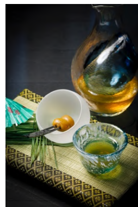
「TENJIN」ザ バー UMAMI SOUR

「TENJIN」オールデイダイニングでは、「サマーアフタヌーンティー - あおね 青嶺- 」が登場します。白桃のムース「白桃 グロゼイユ」や、サブレとムースで夏のアイコンに見立てた「麦藁ぼうし～パッションマンゴー～」、フレッシュな「パイナップル タルト」や、爽やかな甘酸っぱさが心地良く広がる「ババ ピーチメルバ」など、やさしい甘さの白桃とジューシーなトロピカルフルーツの見た目や香り、味わいなどの多彩な表現をご堪能いただけます。また、ランチやディナーでは、ジロール茸やアーティチョークの芳醇な香りを楽しむメイン「仔羊 アーティチョーク チョリソー」や、ベルガモットシロップでマリネした国産桃 1/2 個を贅沢に使ったデザート「白桃 赤紫蘇 ベルガモット」など、夏の食材が主役のこの時期ならではの旬なメニューをご用意しています。