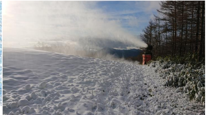
昨年の降雪の様子