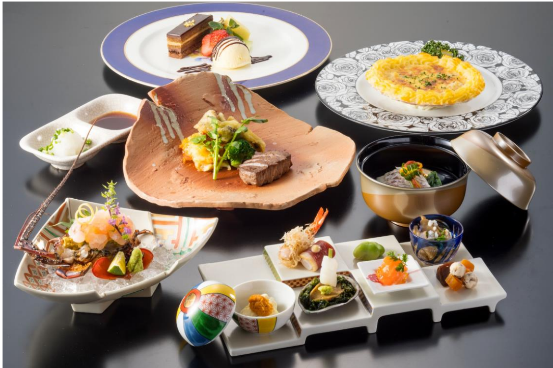
開業 30 周年特別メニュー「慶～YOROKOBI～」