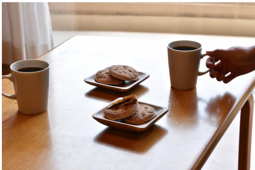
ホテルハーヴェスト鬼怒川特別仕様「きぬの清流」と ホテルオリジナルコーヒー

本プランの特典として、お部屋には「ホテルハーヴェスト鬼怒川 30 周年記念特別仕様のきぬの清流」と「ホテルハーヴェスト鬼怒川オリジナルコーヒー」をご用意します。希少な北海道産大納言小豆と、日光の水で製餡した特別な餡を使用したホテルオリジナルのお菓子と、エチオピア・ケイオンマウンテンファームで栽培され、フルシティーローストされたコーヒーです。