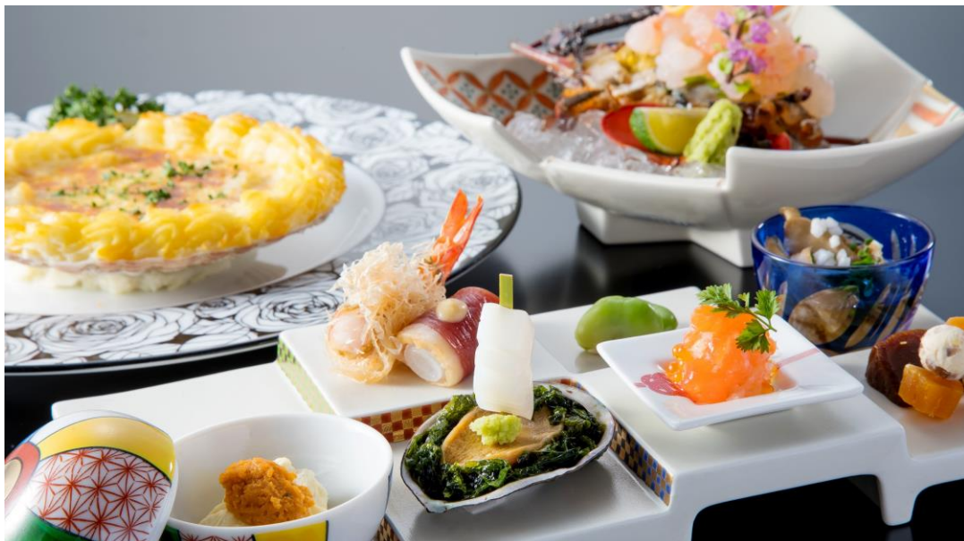
奥左：魚料理「帆立貝のシェルグラタン フローレンス風」