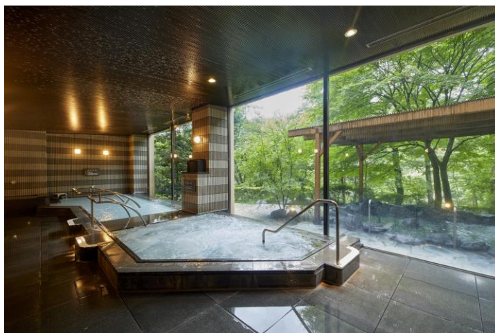
ジャグジー、寝湯、サウナなど充実した温泉大浴場

ホテル 1 階にある大浴場は、敷地内から引く自家源泉を内湯と露天の両方で楽しめます。寝湯やジャグジー、サウナ、ミストルームなど種類も豊富。浴室の内外から鬼怒川渓谷沿いの大自然を間近に望むことができ、新緑、紅葉など四季折々の自然を感じることができます。