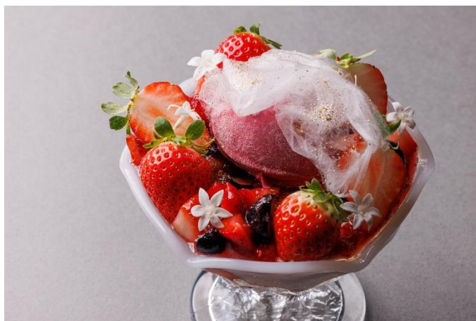
苺 MOCHI パフェ