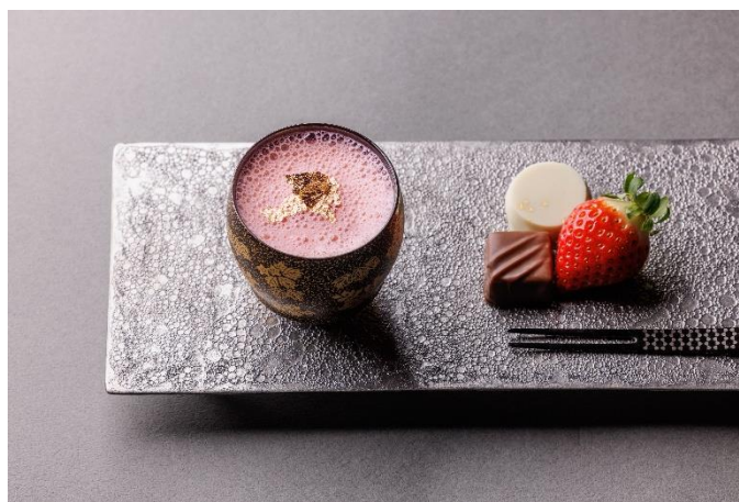
フレーズショコラ