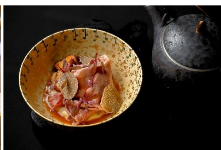
シェフズテーブル 「NIKUJAGA 牛リブロース 大黒本しめじ」