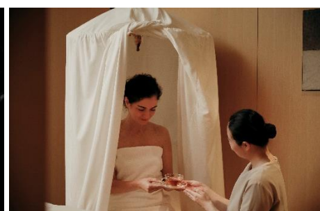
温活スパプラン「THE ROKU SPA ハーバルスチーム&トリートメント」