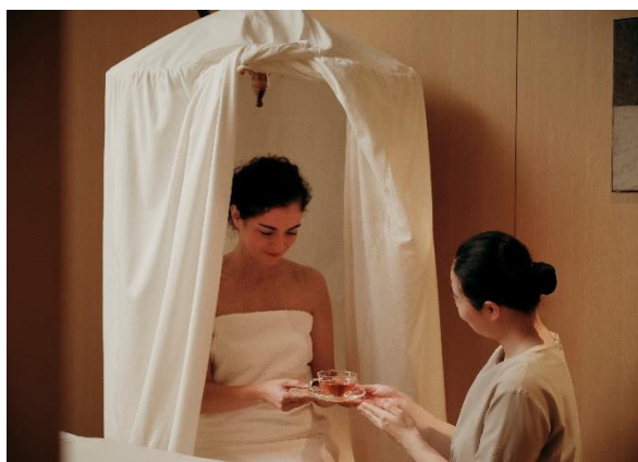
ナチュラルハーバルスチーム イメージ

冷えからくる血行不良や寒さで縮こまった身体をほぐすべく、2023年の冬は「温活」をキーワードに、季節のハーブを用いたハーバルスチームとボディトリートメントを組み合わせた「THE ROKU SPA ハーバルスチーム&トリートメント」を販売いたします。ハーバルスチームは、別名「よもぎ蒸し」ともいわれ、漢方薬の蒸気を身体に当てて皮膚や粘膜から薬効成分を吸収させ、発汗とともに老廃物を排出、体温の上昇により基礎代謝を上げるのが特徴です。THE ROKU SPA では、国産のヨモギやユーカリ、ミカンの皮のほか、黒文字やエストラゴン、ダイウイキョウなど数種類のハーブを組み合わせた蒸気をゆっくりと身体の下から当てていきます。ハーブの香りに包まれた後、オリジナルアロマブレンドオイルを使用したボディトリートメントで、温まった身体をさらにほぐしていきます。トリートメント終了後には、身体と心を緩めるホットジンジャーティーをご用意。トリートメント全体を通じて身体を芯から温めていただき、保温と発汗により新陳代謝を高めることで、身体の不調改善を目指します。ホテルSPAで体験するハーバルスチームで、至福のリラックスタイムをお過ごしください。