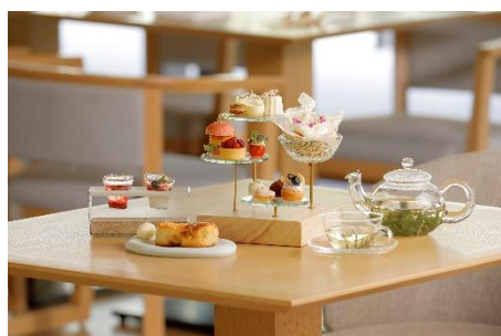
アフタヌーンティー -kitayama sugi-