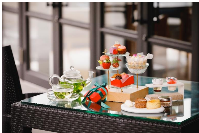
アフタヌーンティー～St. Valentine's Day 2024～