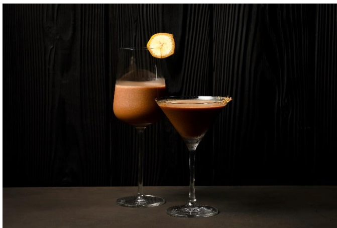
バレンタインショコラカクテル2種

バレンタインシーズンを迎えるレストラン TENJIN では、ショコラとベリーが主役の「アフタヌーンティー～St. Valentine's Day 2024～」を1か月間限定でご提供いたします。いちごのマカロンやラズベリークリームのカップケーキ、ブラックベリーのムースなど甘酸っぱいベリーで仕立てたスイーツのほか、ポンポンショコラやチョコレートの焼き菓子を詰め込んだギフトボックスが並び、レッドやピンクで彩られたスイーツ&セイボリーが大切な方とのティータイムに華を添えます。