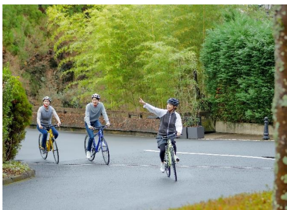
京都リフレッシュサイクリング イメージ

京都洛北の唯一無二の環境を活かしたウェルネスアクティビティを提供する THE ROKU SPA からはこの春、新アクティビティ「京都リフレッシュサイクリング」が登場いたします。トレーナー先導のもとクロスバイクでホテルを出発し、四季折々の風景が楽しめる観光スポットや鴨川、神社仏閣など京都市内を気持ちよくサイクリングで周っていただきます。春限定コースとして、桜の名所を巡る「SAKURA ツーリング」と、青もみじスポットを訪ねる「KAEDE ツーリング」の2コースをご用意。3月から5月の季節の移り変わりやおお客様のご希望・体調に合わせたコースプランニングをご提案いたします。本格的にサイクリングを楽しみたい方から初心者の方まで、適度に身体へ負荷を掛けながら、京都ならではの自然景観や歴史情緒あふれる街並みを満喫いただけます。心地の良い春風を浴びながらゆるやかなアップダウンを駆け抜ける自転車旅で、観光とワークアウトを一緒にお楽しみください。