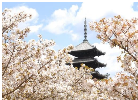
仁和寺 名勝 御室桜

ROKU KYOTO のコンシェルジュがプロデュースする今春のステイプラン「ROKU KYOTO×仁和寺 プライベート観桜宿泊プラン」では、ROKU KYOTO にご宿泊をいただいた翌朝、開門前の桜咲く仁和寺にて僧侶のご案内による早朝特別拝観にご参加いただけます。悠久の歴史を持つ世界遺産「仁和寺」は、歴代の門跡を皇族が務めていたことから別名「御室御所」とも呼ばれ、古くから皇室と繋がりが深い格式高い寺院の一つです。本プランでは、四季の風物が描かれた襖絵を設えた宸殿にてお菓子とお抹茶のもてなしを愉しんだ後、僧侶のプライベートガイドとともに通常非公開の御堂や寺宝を巡る早朝特別拝観へとお連れいたします。仁和寺の歴史秘話や皇室との関わりについての貴重なお話を僧侶から直接伺うことのできる時間は、日本の歴史・文化への知見を深める唯一無二の体験です。境内をゆっくりと歩いた最後には自由時間として、約 200 本が咲き誇る名勝 御室桜を心ゆくまでご鑑賞いただけます。遅咲きの御室桜のほか、ソメイヨシノや枝垂桜、緑の桜として知られる希少な“御衣黄桜”など、訪れる時期によって様々な種類の桜を愛でることができます。静寂な空気の中で心を落ち着ける朝のひとつ、仁和寺の特別早朝拝観とともに美しい一日の始まりをお迎えください。