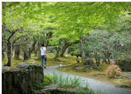
メディテーションウォーク

草木が芽吹く季節、全身で春を浴びるべく、深呼吸をしながら自然の中をゆったりと歩くメディテーションウォークとボディトリートメントを組み合わせた「THE ROKU SPA プレスオブスプリング」を販売いたします。THE ROKU SPA がご提案するウェルネスアクティビティの1つ「メディテーションウォーク」では、普段の生活では無意識に行われている呼吸に意識を向け、足裏で大地を感じながら、しょうごんの緑豊かな自然の中をゆっくりと歩きます。川のせせらぎや鳥のさえずりに耳を澄ませながら自身の内面と向き合うことで、深いリラクゼーションへと導くことを目的としたセッションです。春の陽気をたっぷりと身体に取り込んだ後は、ほんのりと灯りが照らす落ち着いたスパ空間にて、桜のフットバスやオリジナルアロマブレンドオイルを使用したボディトリートメントで全身を流し整えていきます。トリートメント終了後には、桜の優しい香りと味わいが広がる桜ティーをご用意。気候や環境の変化により身体の不調を感じやすい春、雄大な自然に包まれて心身ともにリフレッシュするひとときをご体験ください。