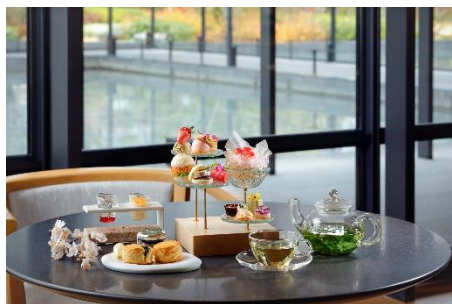
アフタヌーンティー -kitayama sugi-