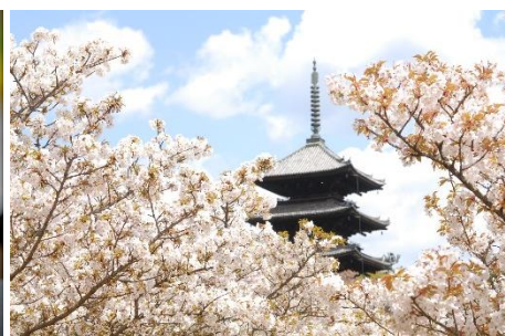
ROKU KYOTO×仁和寺 プライベート観桜宿泊プラン