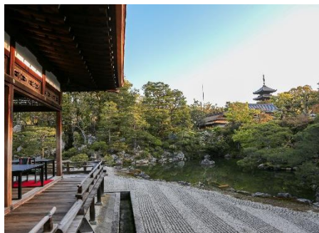
仁和寺 特別早朝拝観