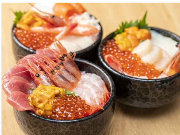
函館朝市でのご朝食