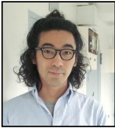
建築家 中山英之（なかやま・ひでゆき）

ウェブサイトよりお申し込みください。先着 30 名様限定。 http://niessing.jp