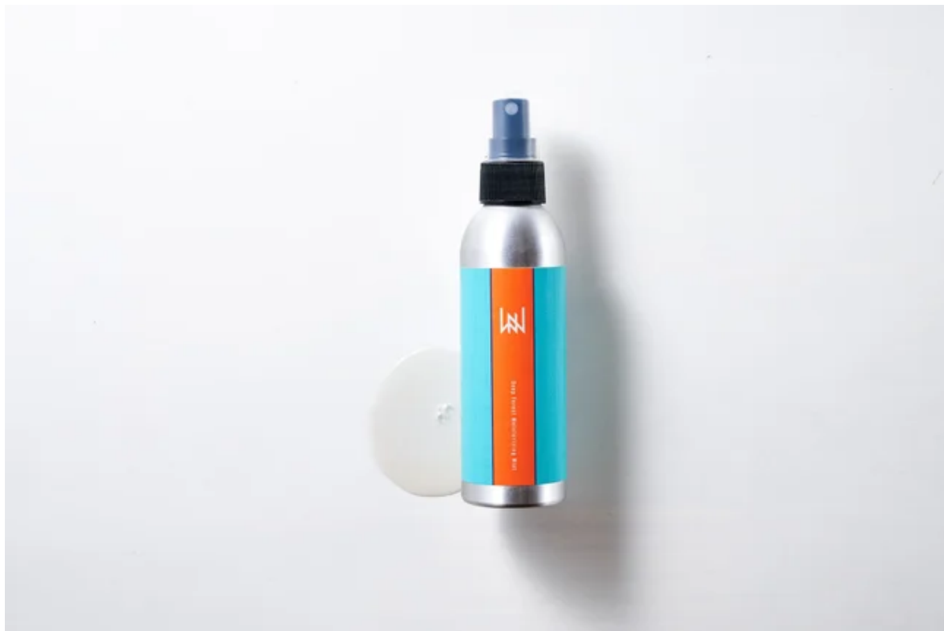
商品イメージ画像1