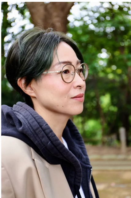
クリエイティブディレクター