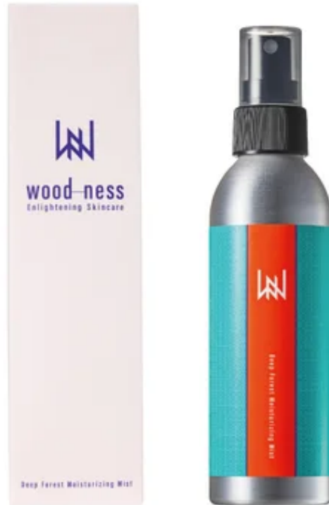
商品イメージ画像2