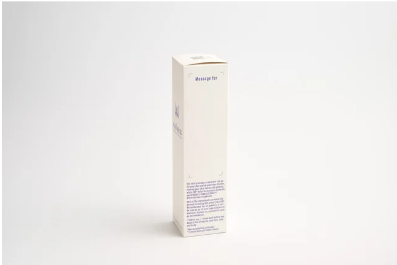
メッセージ欄付き化粧箱

性別に関わらず化粧水を使うことで精神的な心地良さを感じられる「白檀」のお香の香りと、「ゼラニウム」のハーブの香りを配合しました。また、化粧箱には「メッセージ欄」を設け、プレゼントとして言葉を添えて贈っていただける製品です。製品を通して社会や人とのつながりに貢献します。