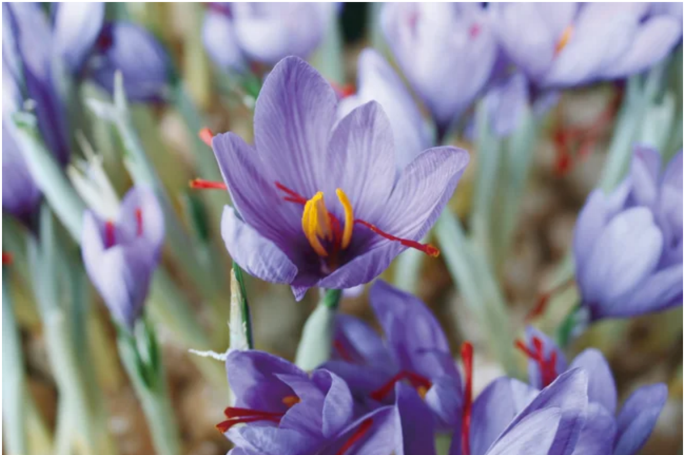
日本のサフランの花

容器は、リサイクル率の高いアルミニウムボトルを採用し、ラベルは再生紙、化粧箱はサトウキビを絞った後に残る繊維(バガス)を使用した環境配慮型の紙を使用しています。さらに、分別して廃棄してもらうため、ラベルは剥がしやすいものを採用しました。