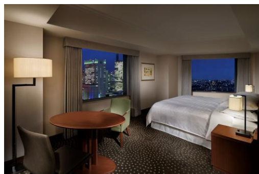
横浜の夜景を眺めながらゆっくりお部屋でリラックス