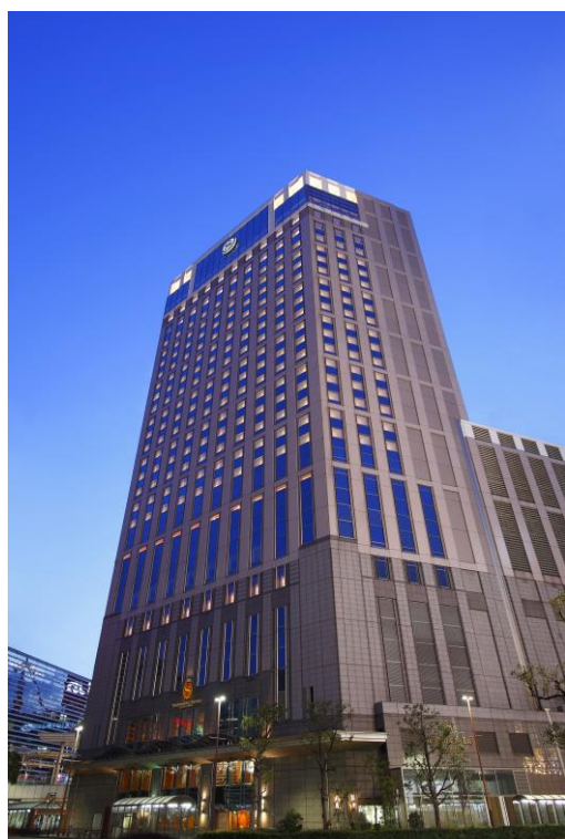
横浜駅から徒歩1分 横浜ベイシェラトン ホテル

鎌倉で歴史や自然を満喫した後は、ホテルの客室から臨む横浜の景色を眺めながらのんびりと贅沢に夜をお過ごしいただけます。気の合うお友達やご家族、カップルで、和の風情を存分に味わえる小旅行をぜひお楽しみください。