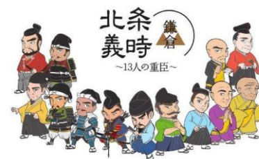
「鎌倉殿と13人の重臣」ゆかりの地も楽しめる