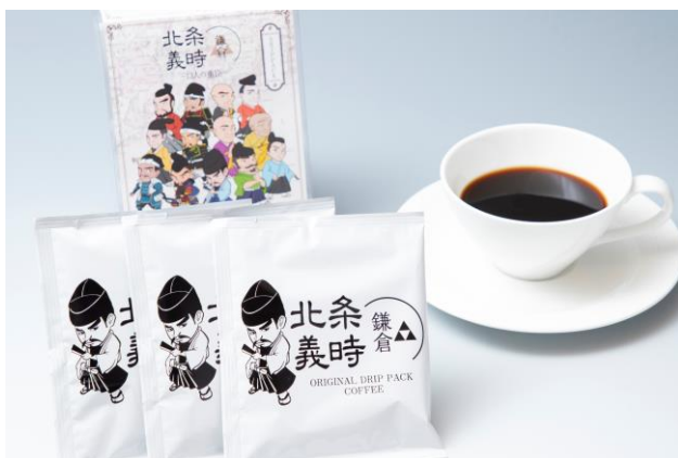
「鎌倉殿と13人の重臣たち」のイラスト入り ドリップパックコーヒーをプレゼント