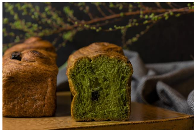
お土産のホテルメイド“抹茶プレミアムデニッシュ食パン”